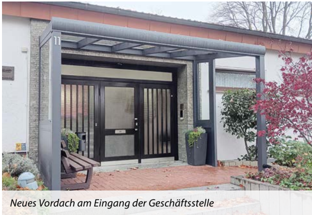
Neues Vordach am Eingang der Geschäftsstelle

la Hülsmann renoviert. Der alte Teppich wurde entfernt und durch einen modernen und pflegeleichten Vinylboden ersetzt. Im Anschluss wurden die Räume gestrichen und mit neuen Gardinen ausgestattet. Im Herbst wurden das Vorstandszimmer und das Büro von Frank Gerber und Dennis Hemker in gleicher Weise erneuert. Zusätzlich wurde die Eingangstür neu angestrichen und mit einem Vordach versehen.