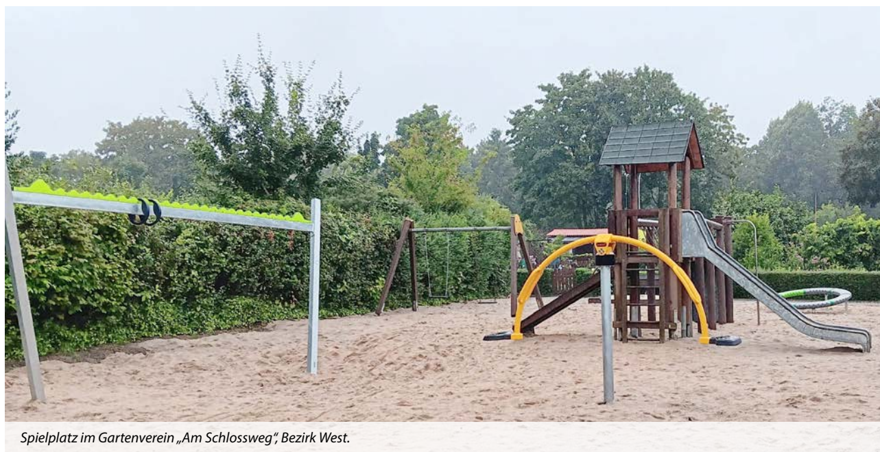
Spielplatz im Gartenverein „Am Schlossweg“, Bezirk West.