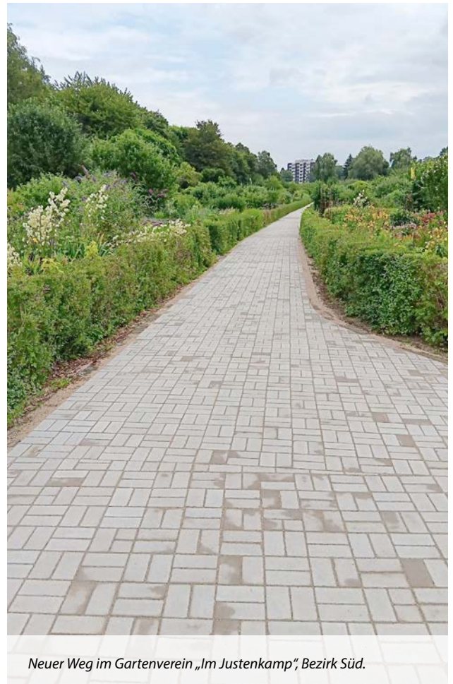
Neuer Weg im Gartenverein „Im Justenkamp“, Bezirk Süd.