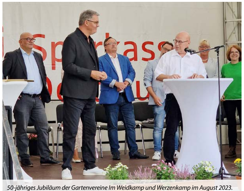
50-jähriges Jubiläum der Gartenvereine Im Weidkamp und Werzenkamp im August 2023.