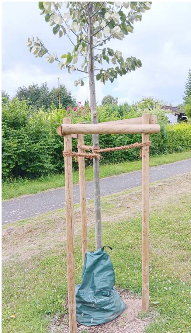
Neu gepflanzter Baum in einer Dortmunder Gartenanlage