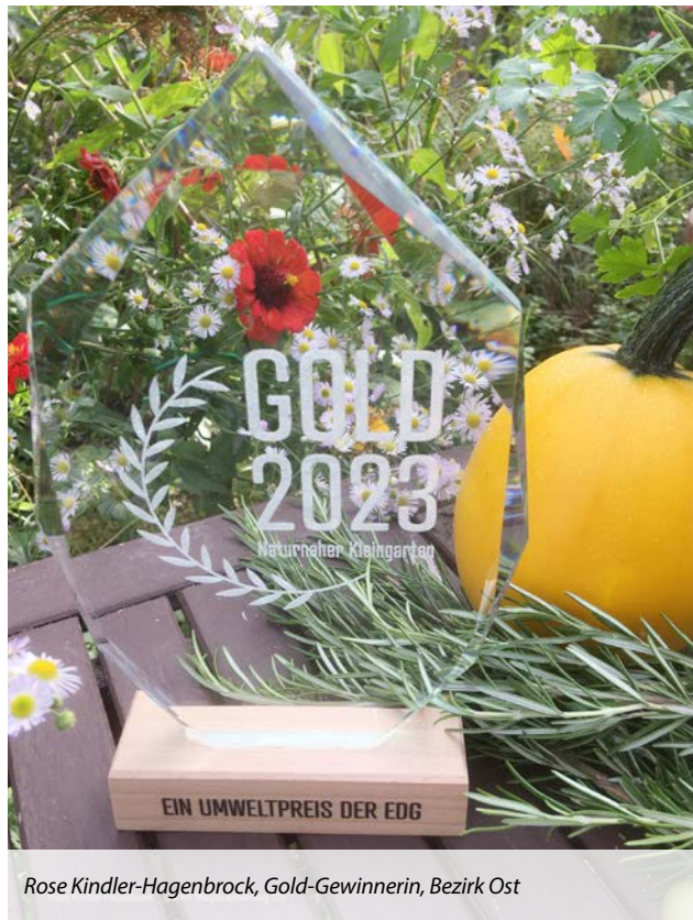
Rose Kindler-Hagenbrock, Gold-Gewinnerin, Bezirk Ost

Im Anschluss fand die Siegerehrung statt. Dabei wurden die Gartenfreunde und Gartenfreundinnen in der Reihenfolge der Besichtigung durch die Jury auf die Bühne gebeten. Es war also bis zum Schluss spannend, da jedes Mal aufs Neue Gold, Silber oder Bronze möglich war. Insgesamt wurden sieben Mal Gold vergeben, 12 Gärten wurden mit Silber ausgezeichnet und 11 mit Bronze.